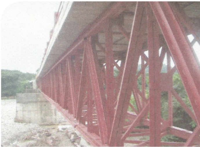
PUENTE RAMON NONATO PEREZ LUZ = 50 METROS CLIENTE: INVIAS