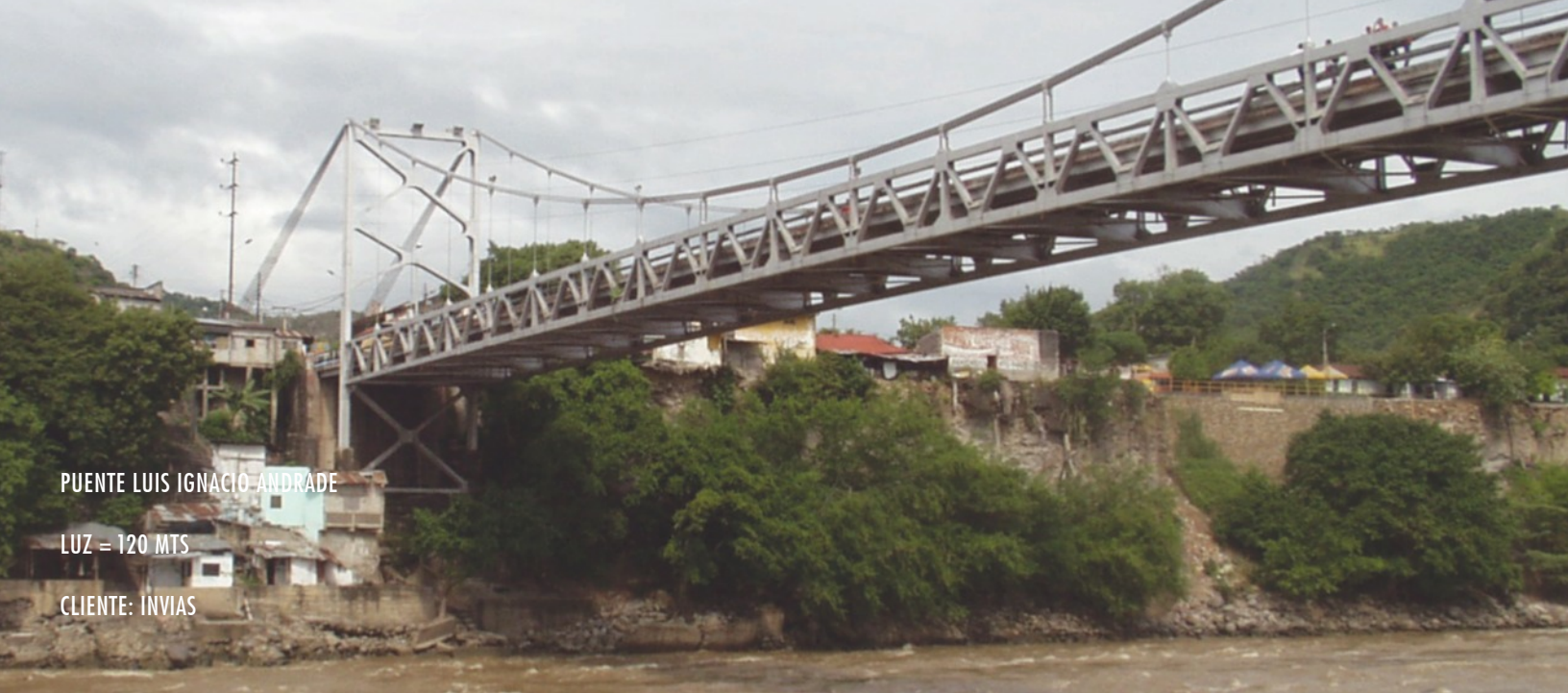
PUENTE LUIS IGNACIO ANDRÁDE